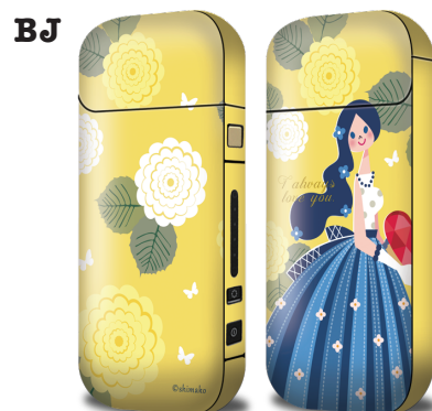
love you 2