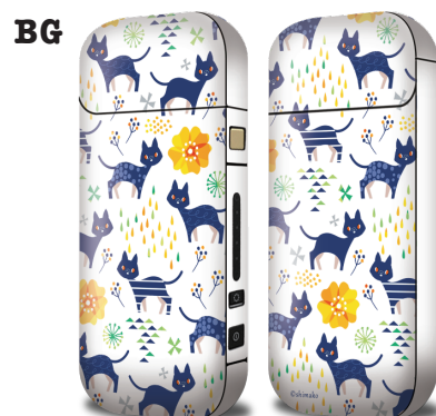
Cat Pattern 1