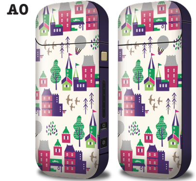
町並み(ナチュラル)