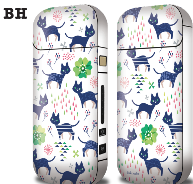
Cat Pattern 2