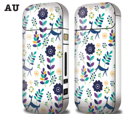
ガーリーフラワー