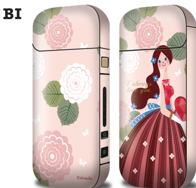
love you 1