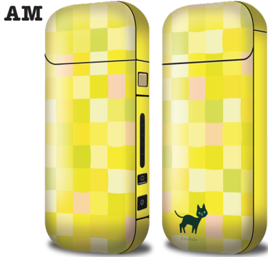
スクエア(イエロー)