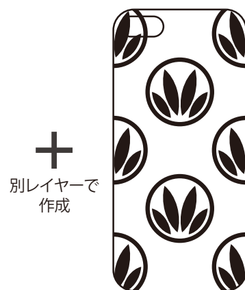
白ベタ用レイヤー