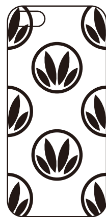
白ベタ用レイヤー