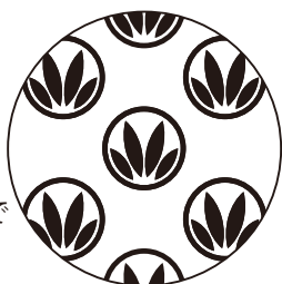
白ベタ用レイヤー