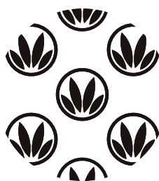
白ベタ用レイヤー